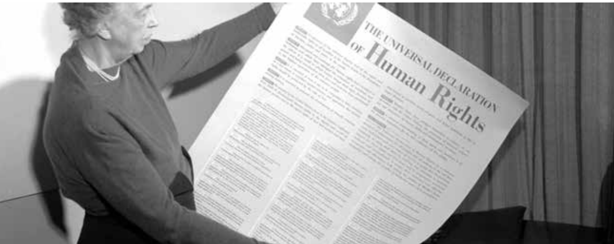
Eleanor Roosevelt sostiene en 1949 la declaración de los derechos humanos